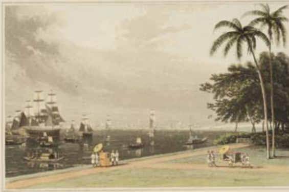
VIEW OF CALCUTTA FROM THE GARDEN BRIDGE. Painted by Robert R. Taylor, R.S.A. 1807. Engraved by W. B. Parry, del. & J. Smith, sculp.